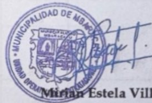
Miriam Estela Villalba Responsable de la UOC

Se remite adjunto el formulario a ser completa en medio magnético, la cual debe ser completado con la firma, aclaración y sello de la empresa. -----